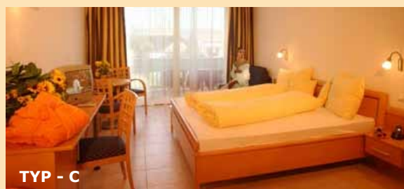
TYP - C