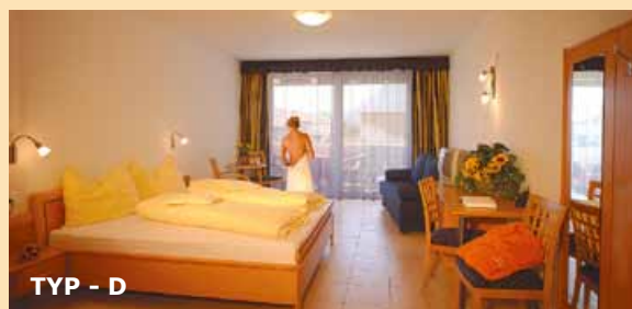
TYP - D