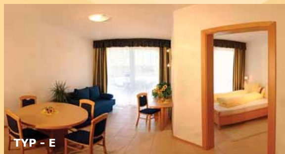
TYP - E