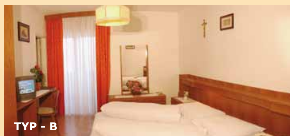
TYP - B